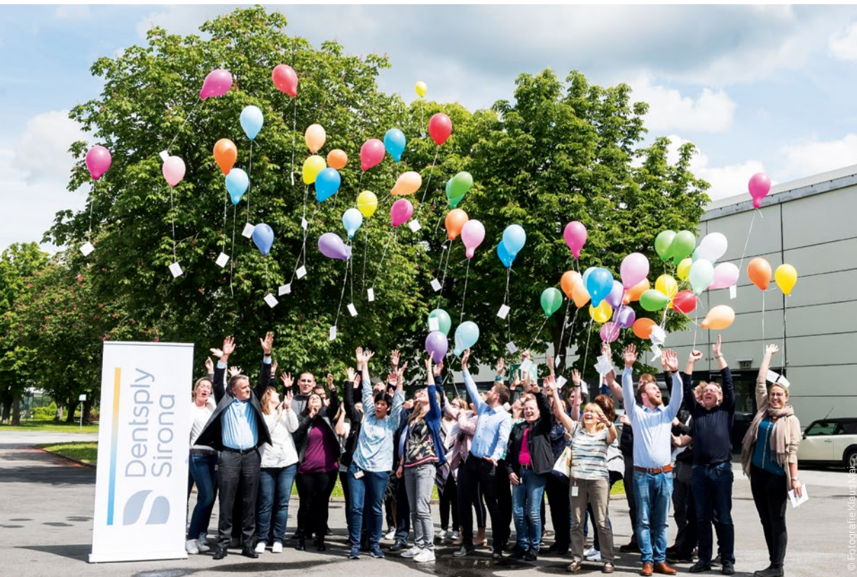
Mitarbeiterinnen und Mitarbeiter in Bensheim lassen im Zeichen der Vielfalt Luftballons in den Himmel steigen.

Dentsply Sirona setzt seit jeher auf Vielfalt im Unternehmen.